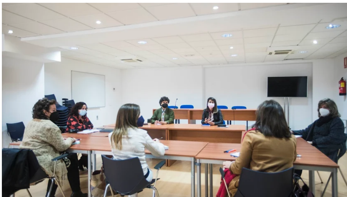
Reunión entre la Diputación y el Colegio de Graduados Sociales de Almería.

Diputación y el Colegio de Graduados Sociales trabajan en sellar una alianza para su creación